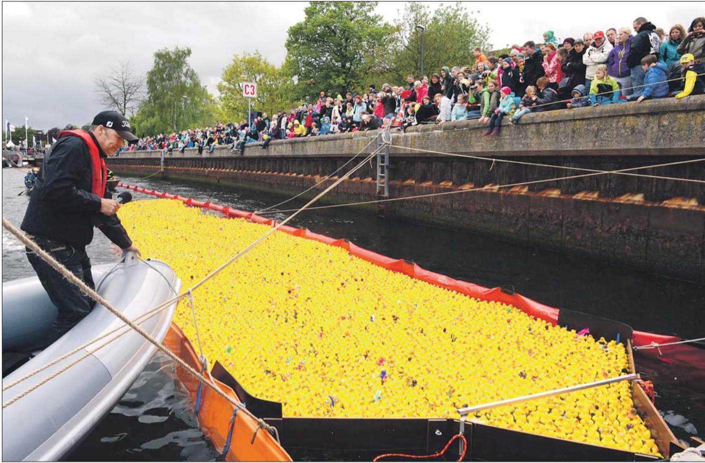
Der Höhepunkt des Kids-Festivals: 10 000 Rennenten schwammen zugunsten des Antoniushauses in Elmschenhagen vor der Kiellinie um die Wette. Heute werden die Gewinner bekanntgegeben.

Das Rennen beim Kids-Festival erhöht die Gesamtspendensumme auf jetzt 557 000 Euro – Erlös geht dieses Jahr an das Antoniushaus